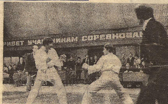
НА СНИМКЕ: в зале спорткомплекса «Юность».